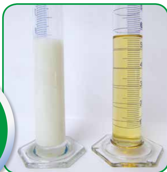
VERTIMEC PRO VERTIMEC EC