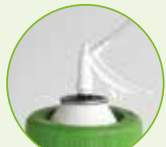
Erogatore a grilletto + ugello