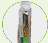
Confezione di Box T Pro Press